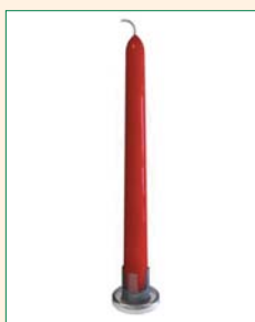
Distanzhalter einzeln = Kerzenständer

Saugnapf und Distanzhalter durch einfaches Zusammen-drücken verbinden (Abb. 1), Saugnapf befeuchten und mit einem Kochlöffelstiel fest an den Boden der kleinen Velou-Vase drücken (Abb. 2). In der kleinen Schale innen mittig und am Boden der Schale je einen Distanzhalter befestigen. Die Distanzhalter der Schalen und der Vase zusammenstecken (Abb. 3).